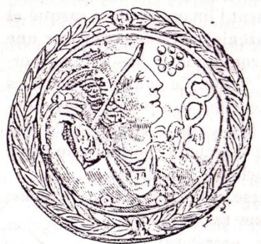
Fig. 4853. — Bourse de Mercure.

On pourrait proposer bien d'autres étymologies de ce nom énigmatique. Par exemple, la première partie de son nom, MER, viendrait de mereo (mériter, gagner sa récompense, acquérir). Mercur e porte d'ailleurs une bourse .