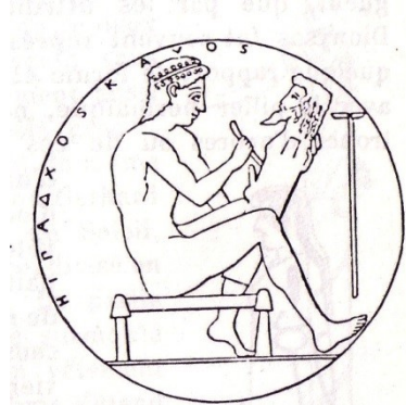
Fig. 3813. — Hermoglyphe.

Le mont Cyllène où est né Mercure, vient du grec κυλλος, courbé, tordu, déformé. Selon Festus, cela indiquerait ceux qui n'ont pas l'usage de certaines parties du corps. On aurait attribué cet adjectif à Mercure car son discours accomplit tout sans l'usage des mains . Ce serait la raison pour laquelle les bornes (les hermès de pierre) étaient façonnées en bustes carrés sans bras.