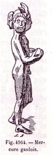
Fig. 4964. — Mercure gaulois.

Disons-le d'emblée : il n'y a qu'un Mercure, ou plutôt deux : l'un volatil, et l'autre fixé en sel par le soufre. Celui-là est connu dans tous les lieux et dans tous les temps par ceux qui ont reçu de le connaître. Néanmoins, les mots pour l'enseigner différant selon les circonstances, il est nécessaire, par souci de clarté, de se limiter. Nous avons donc choisi d'étudier ce qu'en disent les Latins.