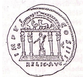
Fig. 4958. — Temple de Mercure.

Pourrait-on y voir aussi la racine marquer qui est pourtant germanique ? En tout cas, les Étrusques qui